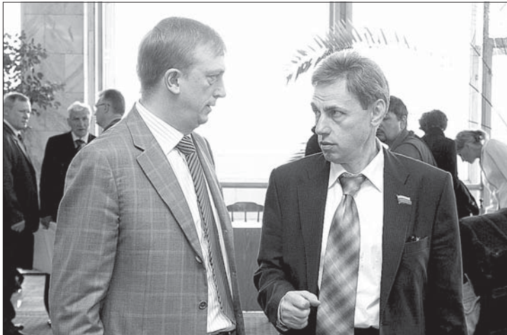
Министр здравоохранения НСО Олег Агеев и депутат Вячеслав Маркелов

Корректировку бюджета комментировали журналистам спикер Совета и губернатор. Дополнительные деньги на дороги и детсады, почти миллиард рублей, Алексей Беспаликов назвал «главными поправками». Новосибирск получит на ремонт дорог 110 миллионов — очень кстати после суровой зимы. Да и селяне не забыли: более 150 миллионов пойдут на дороги и тротуары внутри населённых пунктов. А реконструкция детских садов на 190 миллионов позволит получить дополнительно не менее двух тысяч мест.